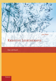
Udo Baer Kreative Leibtherapie Das Lehrbuch